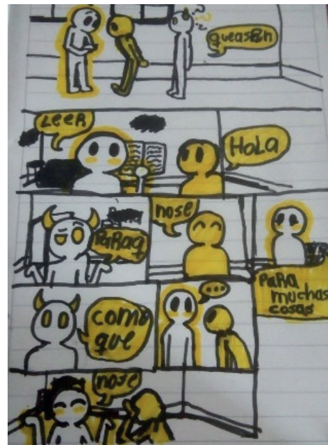
Dibujo 2. Elaboración propia. (2020)

Iniciando la cuarentena, he llegado a notar que, aparte de ser una época de tener ganas de romper una ventana y también de tener ganas de darle en la geta a un desconocido en la calle, es una época para aprender y hacer cosas que no pudiste hacer anteriormente a ella, pero igual no las vas hacer por ¡¡¡pereza!!!