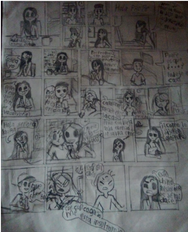
Dibujo 5. Elaboración propia. (2020)

esta época de encierro en nuestras casas, lo sentimos más para poder sobrellevarla mejor.