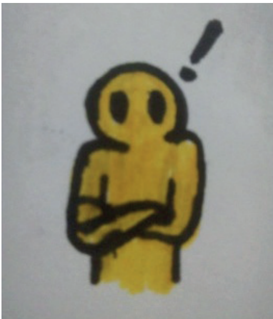
Dibujo 1. Elaboración propia. (2020)

Villegas, A. (2020). ¡El Otro soy Yo!. Revista Mova, 2(2).